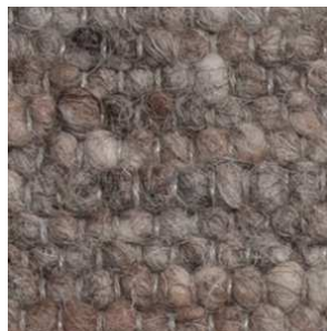
col. 1234 Koala