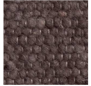
col. 1008 Coffee