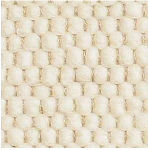
col. 1001 Wool White