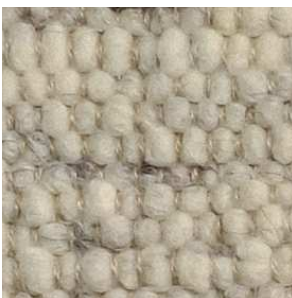
col. 1801 Birch