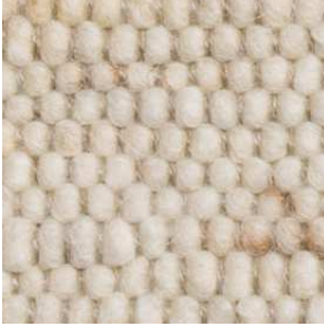
col. 1100 Bone