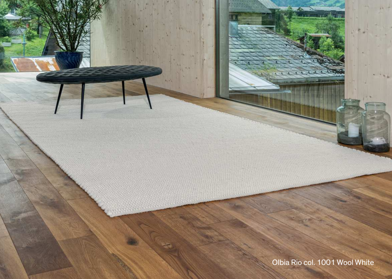
Olbia Rio col. 1001 Wool White