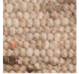
col. 1102 Marble