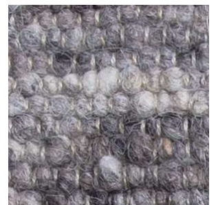
col. 1803 Rocks