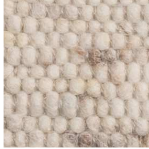
col. 1101 Almond