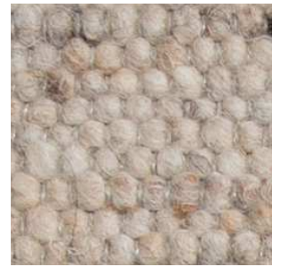
col. 1232 River Bed