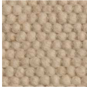
col. 1002 Champagne