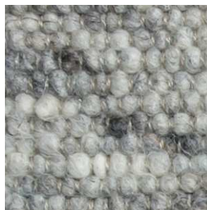
col. 1802 Stones