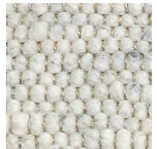
col. 1800 Cliffs of Dover