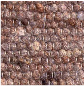
col. 1213 Bark