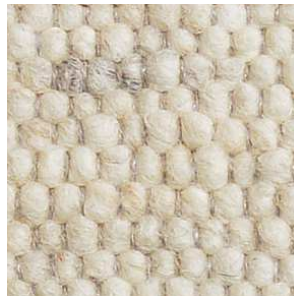
col. 1231 Carrara