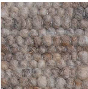
col. 1233 Gravel Road