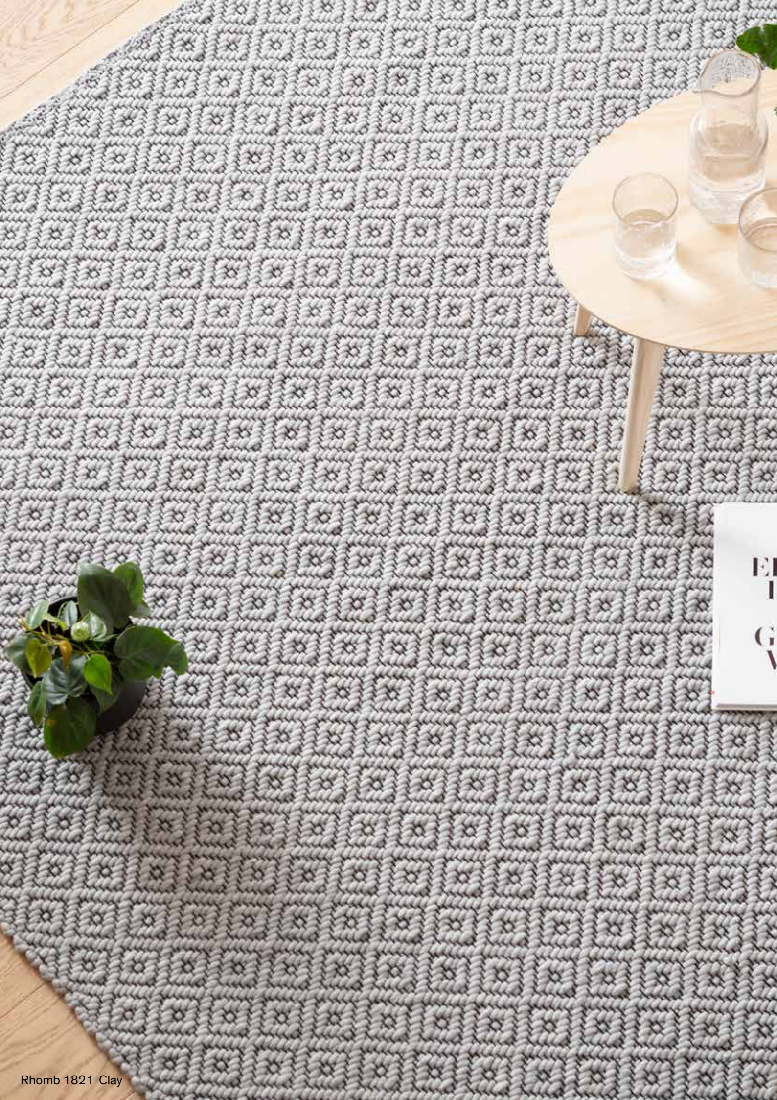
Rhomb 1821 Clay