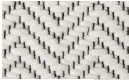
1001 Wool White

70×140, 90×180, 140×200, 170×240, 200×200, 200×250, 200×300, 250×250, 250×300, 250×350 cm