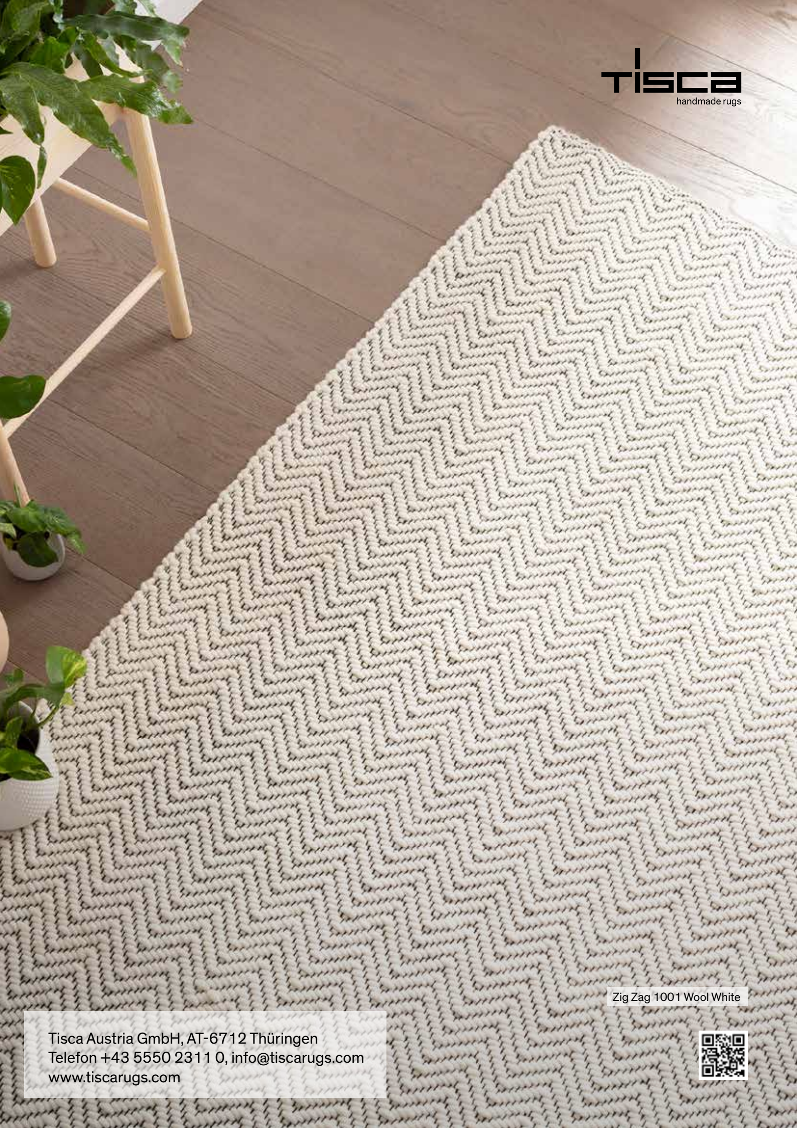
Zig Zag 1001 Wool White

Tisca Austria GmbH, AT-6712 Thüringen Telefon +43 5550 2311 0, info@tiscarugs.com www.tiscarugs.com